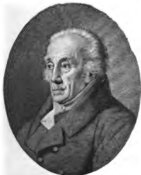
Johann Friedrich Blumenbach.

Homöopathie entgegen, d. h. die Methode, durch ein Arzneimittel einen dem vorhandenen Krankheitszustand möglichst ähnlichen zu erzeugen, um die Lebenskraft umzustimmen. Zu diesem Zwecke müssen die Symptomenkomplexe der einzelnen Krankheiten und die durch Medikamente hervorgerufenen Symptome sorgfältig studiert werden. Auch muss man Arzneigemische vermeiden und nur einfache Arzneien anwenden. Letztere wirken am besten in möglichst grosser Verdünnung. Hahnemann lässt aus den «Urtinkturen», kräftigen spirituösen Extrakten des Mittels, die Verdünnungen herstellen. Je verdünnter, «potenzierter», desto wirksamer ist das Mittel und kann erst dann seine eigentliche «Dynamis» entfalten. Bei flüssigen Substanzen empfiehlt Hahnemann die 30. Potenz: 2 Tropfen der Urtinktur werden mit 98 Tropfen Spiritus ver-